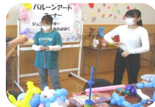
←(写真) JL活動の様子 (令和4年北山交流まつりバルーンアートコーナー)