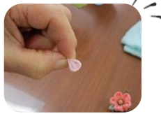
花びら 1 枚分の完成