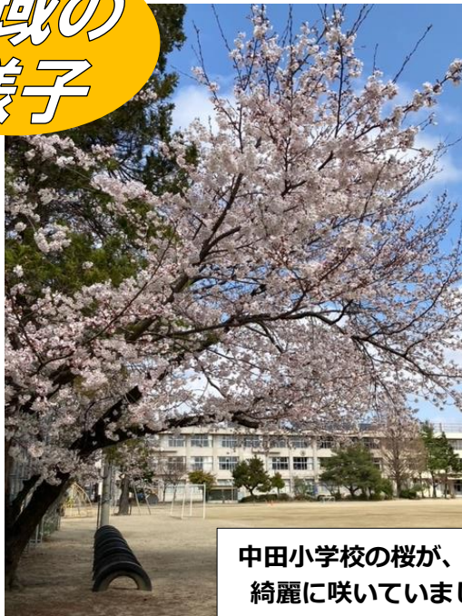
中田小学校の桜が、今年も綺麗に咲いていました。