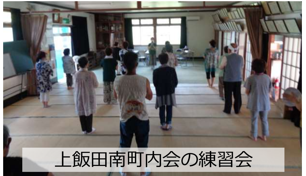
上飯田南町内会の練習会