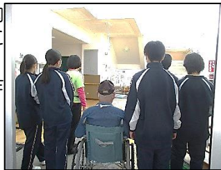
車椅子受入れの様子 (若林市民センターにて)

10/14(土)若林小学校にて若林学区防災協議会による総合防災訓練が行われました。今回の訓練は大雨・洪水時の避難や避難所運営が主な内容でした。災害情報収集方法に関する研修、応急手当や心臓マッサージの方法、テント操作災害時給水栓の使い方などを、地域住民の皆様や若林小児童・八軒中生徒の皆さんが実践を通して学びました。