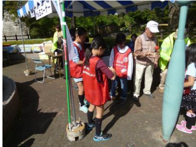
〔けん玉にも挑戦しました〕