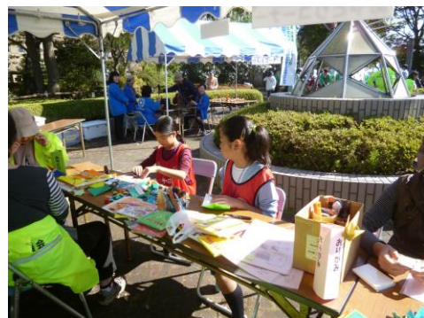
〔折り紙を折っています〕