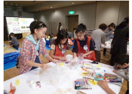
〔ジュニアリーダーとも活動しました〕