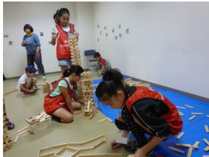
〔カプラで遊んでいるところです〕