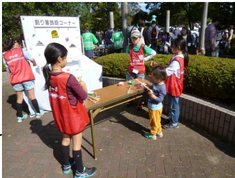
〔射的には小さなお子さんも参加しました〕