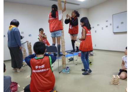
〔天井に届くくらい高く積み上げました〕