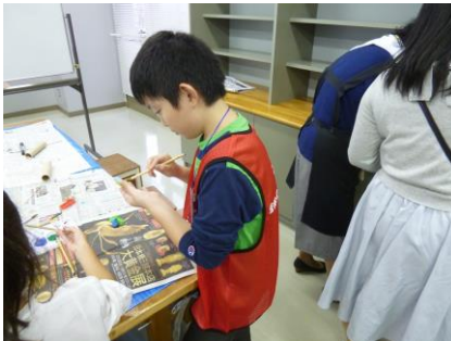
〔ねんどで作った作品に色を塗りました〕