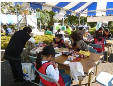
〔お手玉を作っています〕