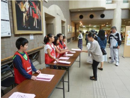
〔受付でプログラムを配りました〕

10月9日(日)は秋休み中の事業「ワカチュウ子どもランド」に参加しました。チャボ!のメンバーは受付での案内のほかプログラムの配布などの活動をしました。メンバーも交代で休憩をとりながらあそびのコーナーや工作コーナーに参加したり、茶道体験で抹茶とお菓子をいただいたりと楽しく活動することができました。