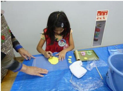
〔紙ねんどで作品を作りました〕