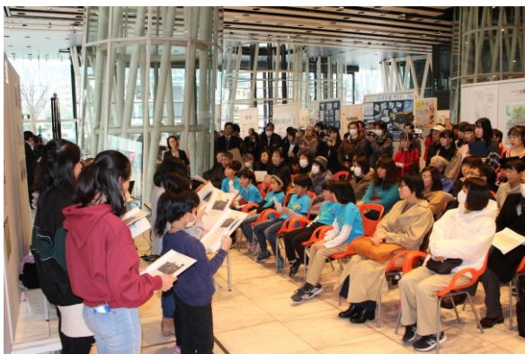
【多くの皆さんの前で発表しました】