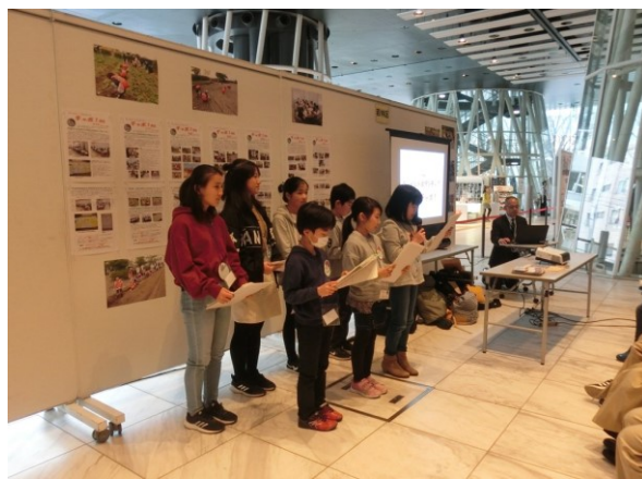
【並び順を変更して発表開始です】