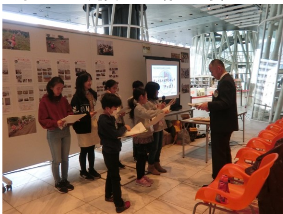
【現場に合わせてリハーサル中です】