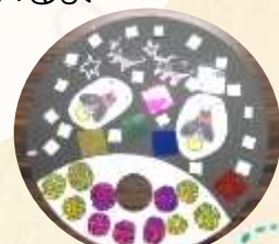
参加者制作のうちわ