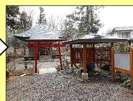
臨濟院公園・弁財天(国見ヶ丘5丁目)