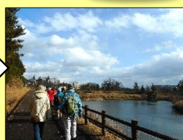
桜の水辺公園(国見ヶ丘3丁目)