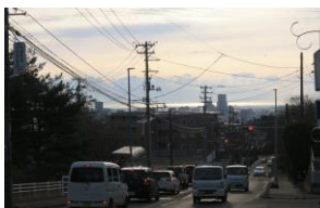
早朝の国見峠の風景

「まちの記録」として大切に活用させていただき、皆さんの思い出深いお店や建物の写真、懐かしい近所の通りの写真を貸していただけませんか? センターまで写真をお持ちください。(複写後は返却いたします。)