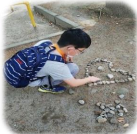
ハートの中にはニコニコ顔が！