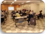
貴重なお話をしていただきました。

「仙台に住んでいながら知らなかったことがたくさんあり、とても勉強になった」「今度実際に足を運んでみたい」という声が多く寄せられました。