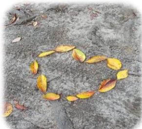
落ち葉でハートを作りました