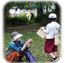
上手くとれたかな？