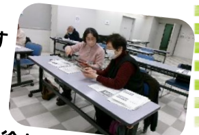
徐々に受講生同士で教えあう場面も