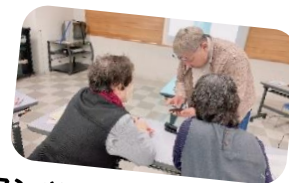
マンツーマンで指導してもらいます