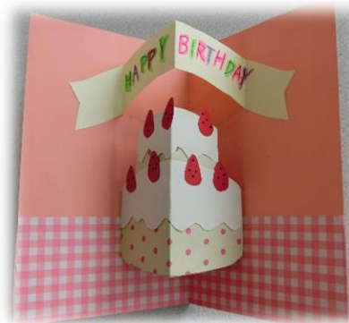
カードのイメージ