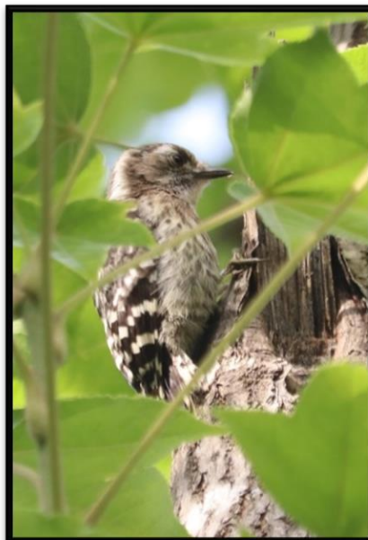
コゲラ(キツツキ科)