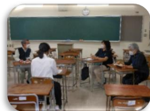
放送部の生徒さんによるインタビューの様子 →