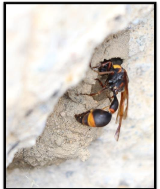
スズバチ(スズメバチ科)

泥で鈴のような壺状の巣を作る。その中に狩った青虫を入れて泥の蓋をする。幼虫は青虫を食べて成長する。