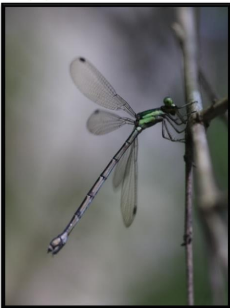
オオアオイトトンボのメス (アオイトトンボ科)