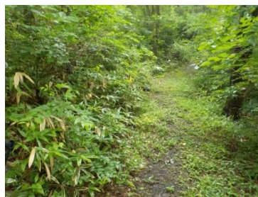
↑・before、草が主に左側からぼうぼうに伸びていた →・after、きれいに下草が刈られた後、広がってきれいに ←・2時間の成果。山積み草