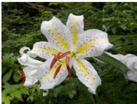
↑・大きなヤマユリが咲いていた