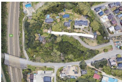
↑「橋場」の前の道路(白い線)が「芋沢街道」だそう。左の縦の線が高速道路で、高速を横切る道路の右方向がケーズデンキ

3月5日は、旧「芋沢街道」を南吉成から活牛寺までの間を探して歩き、お寺の先「馬頭観音」へ行った。