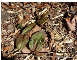
↓カタクリの葉。双葉なので花が咲く

カタクリも葉が出て来た。色々新芽・新葉が出てきている。「センボンヤリ」「ヒトツボクロ」なども見られた。