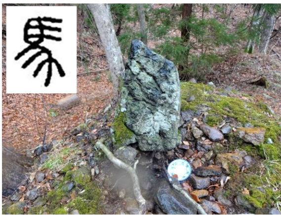
↓象形文字風の、馬の字を刻んでいるような石碑があった

を刻んだものだった。木村さんの説明によると右上図のようなことなのかな。(桧山・記)