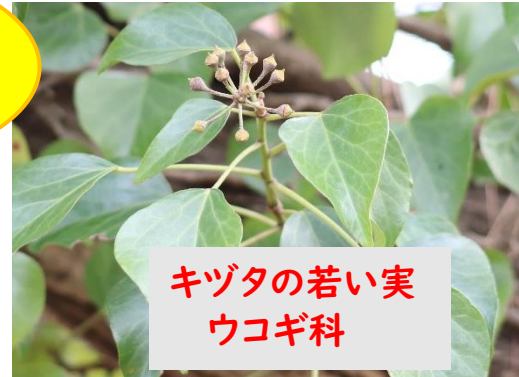
キツタの若い実 ウコギ科