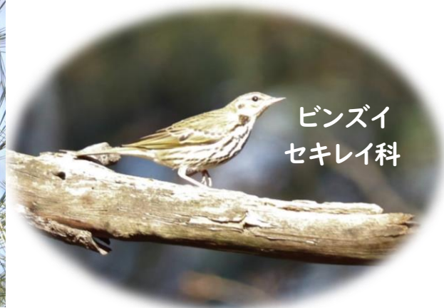
ビンズイ セキレイ科