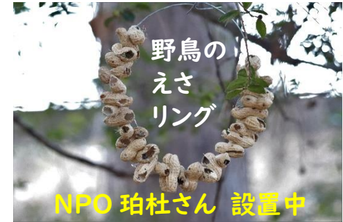
NPO 珀杜さん 設置中