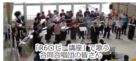
「R6ロビー講座」で歌う 合同合唱団の皆さん

Reservation not required. Free admission. 不需要申請，免費入場。 예약은 필요하지 않습니다. 입장은 무료입니다. बुकिंग गर्न आवश्यक पर्दैन प्रवेश नि:शुल्क छ। Tidak diperlukan reservasi. Tiket masuknya gratis.