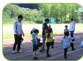
足の上げ方と腕振りが大切！