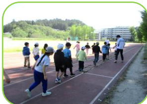
ラダーで足の動きを学んで・・・

「楽しかった！」「前より速くなりました」「学んだことを運動会で使って1位になります！」などの感想もあり、運動会前にとっても有意義な笑顔あふれる時間となりました。