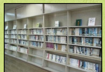
図書ボランティアさんに本を整理していただきました。