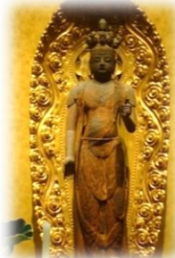
十一面観音菩薩像