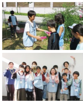
【宮城野区中央市民センター】

「いろいろなことを考えたり、実際にやってみたりするのが楽しかった。」(小学6年生) 「3年生になったらキッズもりあげ隊をやりたいです。」(小学2年生)