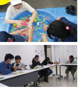
【茂庭台市民センター】

「話し合いや準備作業を通して、自分たちのアイデアを実現する力や仲間と協力する力、達成感や自己有用感が育っています。隊員の子どもたちが、将来の地域をけん引する人材となることを期待しています。」(担当者)