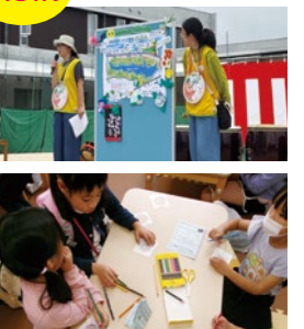
【将監市民センター】

「将監市民センターの「ふるさとづくりプロジェクト」の活動を通して地域とのつながりが増えたと思います。これからも活動を続けて、皆が住んでいる地域に興味を持ってもらい、笑顔を増やしていけたらと思います。」(高校1年生)