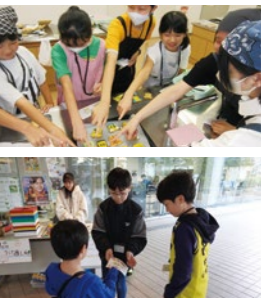
【太白区中央市民センター】

「クイズでたくさんの人に長町を知ってもらえたことがうれしかったです。」(小学6年生) 「活動を通して違う年齢の子や地域の方々と交流することができてうれしかったです。」(小学5年生)