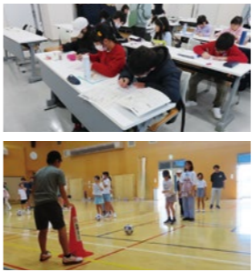
【若林区中央市民センター】

「学校ではできない特別な活動ができてとても楽しい。自分が成長していると実感できた。」(小学6年生) 「チャボに入って、新しい友達や新しい事に出会えたり、たくさんの地域の大人と交流できたりしてよかった。」(中学1年生)