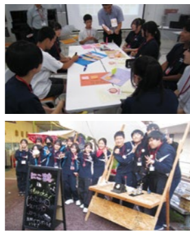
【鶴ヶ谷市民センター】

「小さい子どもから大人まで、いろんな人にたくさん喜んでもらえました。」(中学3年生) 「たくさんの方が来てくれて、企画してよかったと思いました。」(中学3年生)