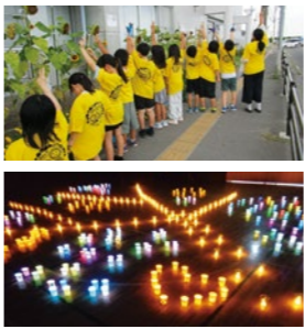
【沖野市民センター】

「地域の方に種から育てたひまわりの苗を渡す時にドキドキした。」(小学4年生) 「沖野東小学校の校長先生にひまわりの苗を渡してうれしかった。」(小学3年生) 「これからかんばんってねと応援してもらってうれしかった。」(小学4年生)