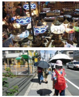
【木町通市民センター】

「それぞれのお店が何を大切にしているのかについて知ることができて、まちの見方が広がった。」(小学6年生) 「デジタルですごろくづくりは初めてだったが、手描きの絵も入れられて前よりもいいものができたと思う。」(中学1年生)