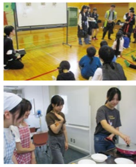
【中山市民センター】

「小学生一人一人をしっかりまとめるのが大変でしたが、楽しんでくれたので良かったです。また機会があればよりよい企画にできたらいいなと思いました。」(Nプロジェクトメンバー)