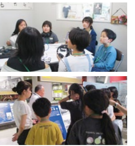
【西多賀市民センター】

「戦争について知らないことが多く、驚きました。」(小学5年生) 「ほかの学校の人と仲良くなれて、コミュニケーションが取れたと思いました。」(小学6年生) 「また来年も『にしたぎキッズ情報局』に参加したいと思いました。」(小学5年生)