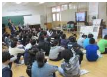
【6年】平和学習のようす