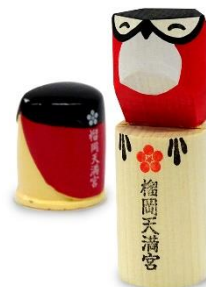
当たりの真っ赤な鶯のお守り(右)と 背中語るタイプのおみくじの鶯

“人生敗者復活戦”。負けても諦めずに復活する美学があるように、良くない事があってもそれをバネにリスタートするのが、本当の強さを手に入れる秘訣なのかもしれません。負けるのは嫌だし良い事だけでもオツケーなのですが、神様はマイナスからプラスに転じる試練の方程式がお好きなようです。2～3月は受験の季節、天満宮は大忙しです。長い人生色々あるものですが、受験生の皆さんにはどうか吉事先行でスタートを切って欲しいものです。(本年度もご覧頂きありがとうございました。関沢)