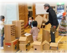
令和3年度の企画会・講座の様子です