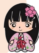
博物館キャラ めごちゃん