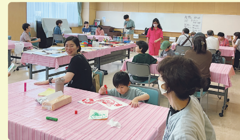
アート体験のようす

ミンナシテマザールは安心して学べる場です。障害の程度や当日必要なサポートを、事前に電話で確認します。必要に応じて、手話通訳の準備をすることもできます。当日は途中で休んでも、帰っても大丈夫です。休憩する部屋もあり、自分のペースで参加できます。