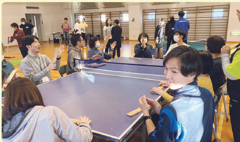
インクルーシブスポーツ（卓球バレー）のようす

ミンナシテマザールはいろいろなことが学べる場です。これまで、 ●アート体験 ●ジャンベ（アフリカの太鼓）体験 ●七夕飾りづくり ●化石レプリカ作り ●インクルーシブスポーツ ●すずめ踊り体験 などに取り組んできました。これからも参加者の声から、新しいプログラムを計画していきます。