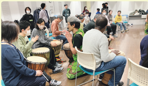
ジャンベ（アフリカの太鼓）体験のようす

ミンナシテマザールは誰でも学べる場です。障害がある人、ない人。こども、大人。外国にルーツのある方など、どなたでも大歓迎です。いろいろな人が、同じ時間・同じ空間を、自分のペースで楽しむことができます。その中で、新しい気づきや楽しさに出会えるかも知れません。