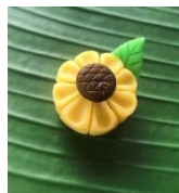
ひまわりの和菓子