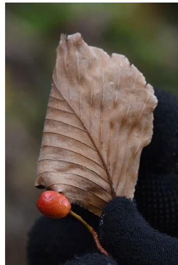
↑裏が白い「ウラジロ」