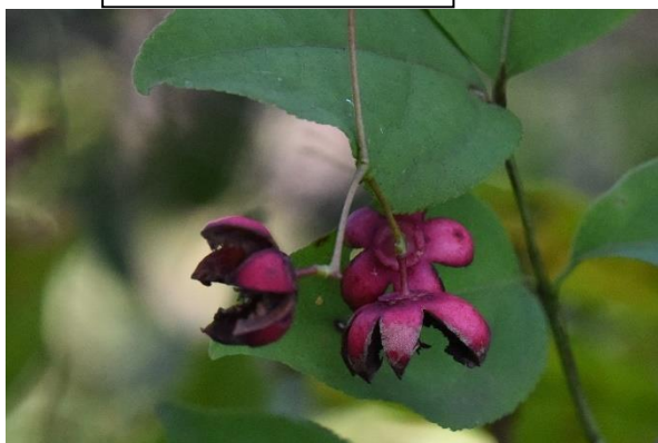
←かわいいツリバナ