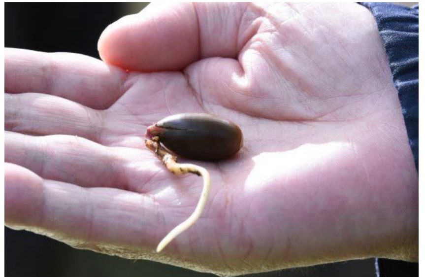
▲ドングリの発根（コナラかな？）