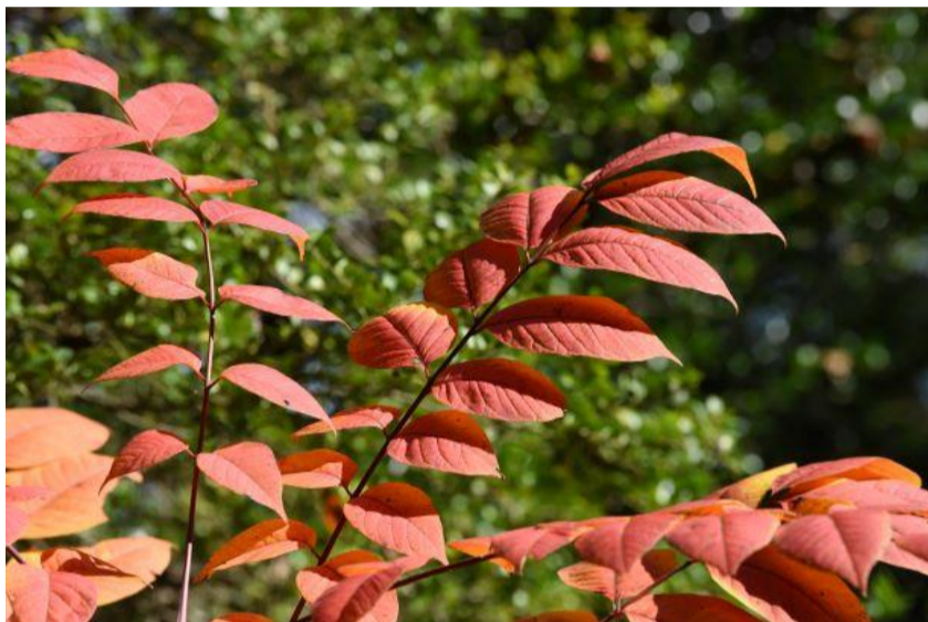
▲ウルシ（アントシアニンが多くて赤色）