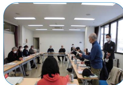
▲制作にかけた想いを語るなど、加茂地域を考える場となりました。

2月10日(木)リーフレット「加茂四季めぐりマップ」のお披露目かねて地域団体や町内の方との交流会を開催しました。制作にまつわるエピソード発表の後、虹の丘・加茂地域包括支援センター、長命館公園サポーターズクラブ、加茂まちづくり協議会の広報誌等の紹介があり、地域について語り合うことができました。