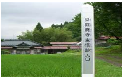
（堂庭廃寺宝塔跡入口の写真）

泉市誌下巻第12節伝説の項に、「大むかし、山の寺から移つた夫婦は、山奥の堂所に住んだ。たまたま旅の僧が訪れたとき大菅谷は、銅谷で拾つた重い石を僧に差し出した。旅の僧はそれを都に持ち帰り、小さな鐘をつくつた。その鐘は、七日七夜鳴り響いた」とあり、この鐘の音に、異人たちの都人に移住を余儀なくされた怨念が込められているように思えた。この銅谷は針生山と呼ばれていた。2022年から分譲が始まつた「朝日」には、針生山内朝日、銅谷山内夕日という地名が残つていた。昔、この一円を所有した長者がふとした原因で亡くなり、その長者がこの地に黄金千樽、朱千樽を埋めたと言われている。