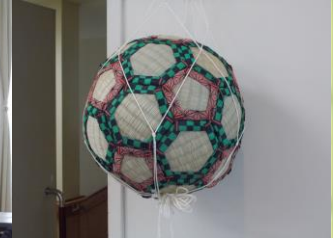
豊のサッカーボール