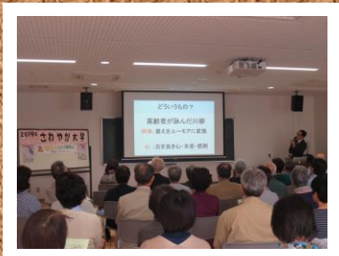
第1回 始まりは笑いから ～シルバー川柳を楽しむ～