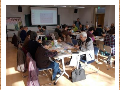
第7回 粘土細工で小物作り