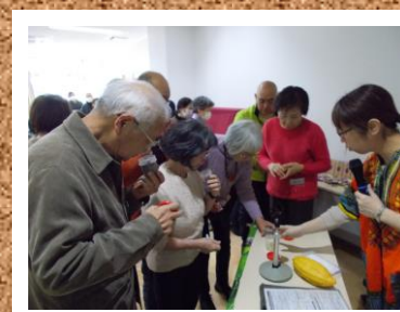
第9回 チョコレートの 世界へようこそ!