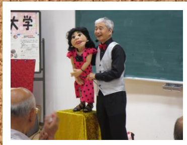
第2回 笑い与健康 演芸鑑賞 腹話術