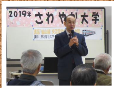
第5回 仙山線(交流電化)のお話