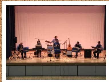
第10回 公開講座 音楽鑑賞 かむりの里コンサート2020 (写真左) 第1部 La・Mer様 (写真右) 第2部 仙台ケルティック楽団様