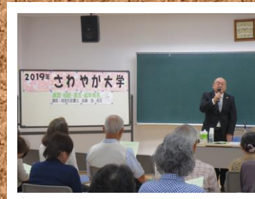
第3回 相続・遺言・成年後見