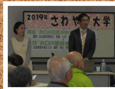
第6回 お口の健康体操 お口の元気は体の元気