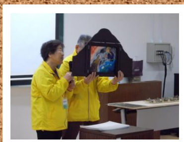
第8回 根白石(中山)街道