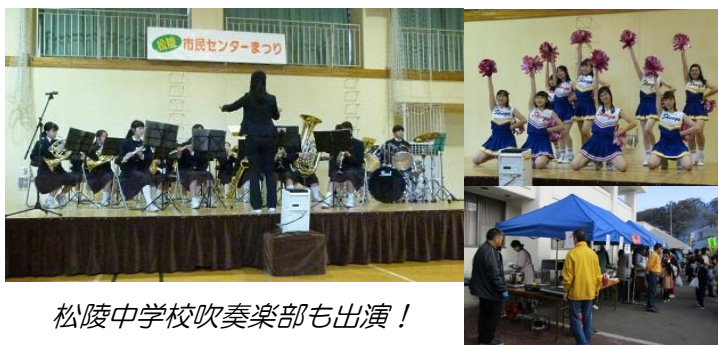
松陵中学校吹奏楽部も出演!