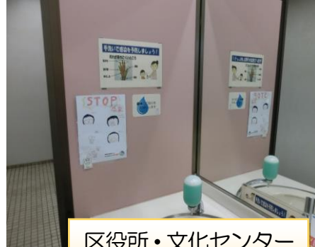
区役所・文化センター お手洗い