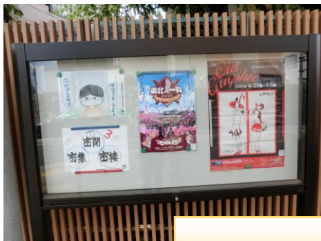
薬師高砂掘り通り 掲示板

5月の活動の1つは「コロナウイルス感染予防ポスター制作」でした。ポスターは、地域内の掲示板や若林区役所の庁舎、文化センター内に掲示されています。ポスターを見た人から「手洗いは30秒を心掛けて丁寧におこなっています」という声をいただきました。地域の皆さんにポスターを見ることで、感染を予防する気持ちを高めていただけたらと思います。