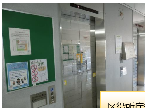
区役所庁舎 掲示板