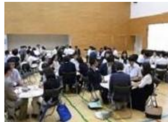
宮城野区 「社会教育推進連絡会・研修会」