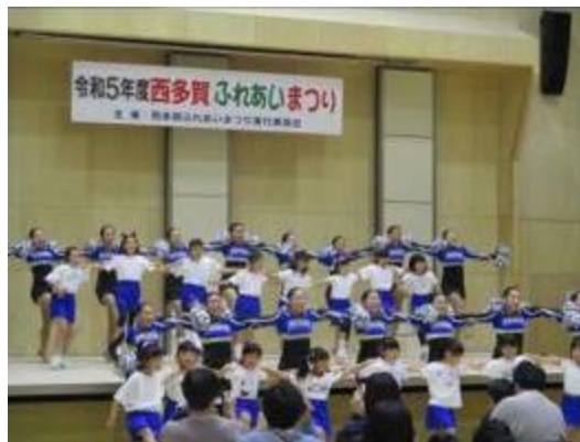
太白区「西多賀ふれあいまつり」