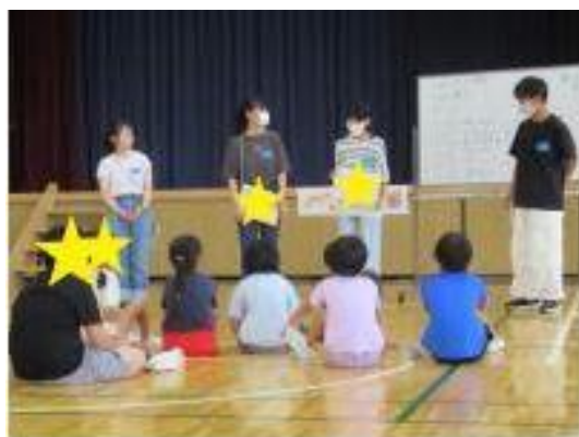
若林区 「ジュニアリーダーと遊ぼう」