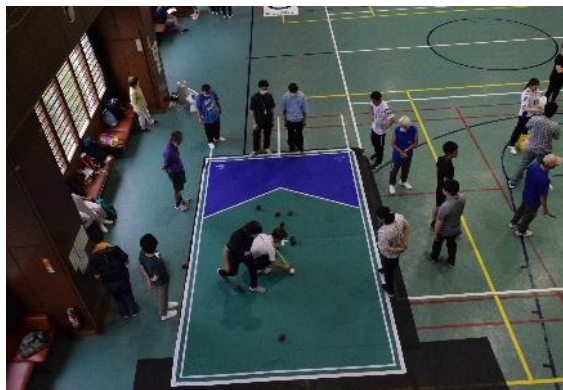
ミンナシテマザール「スポーツ体験」