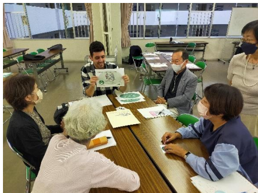
市民カレッジ「防災・減災講座」