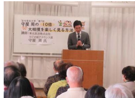
宮城野区「岩切老壮大学」