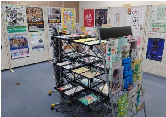
宮城野区（生涯学習支援センター） 「情報コーナー」