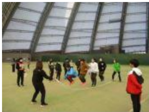
泉区「みんなでジャンプ2」