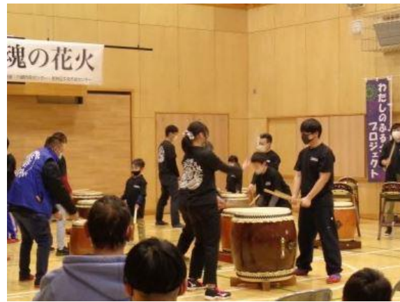
若林区（六郷市民センター） 上「わたしのふるさとプロジェクト」 右「鎮魂の花火」