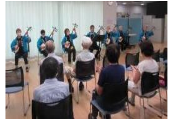
泉区（将監市民センター） 「将監ふれ・ミー♪ふれあいコンサート」