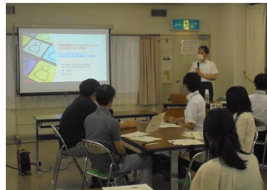
社会教育施設等職員向け研修