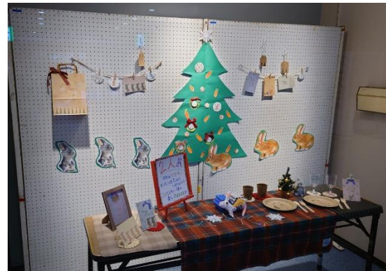
宮城野区（生涯学習支援センター） 「展示コーナー」