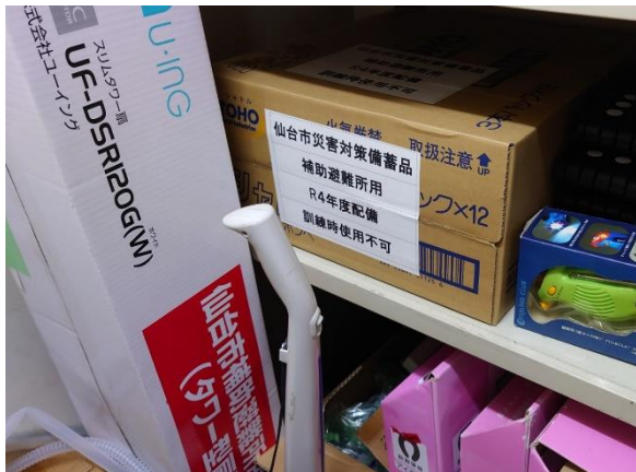
宮城野区（生涯学習支援センター） 「備蓄品」