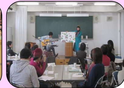
図書室へ行ってみよう! ～図書室四季カフェ～