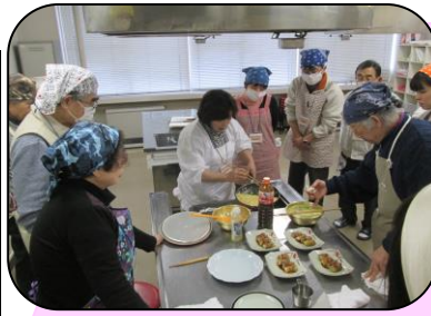
歴史のまち・岩切の四季 ～ 冬の章