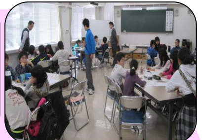
インリーダー研修会