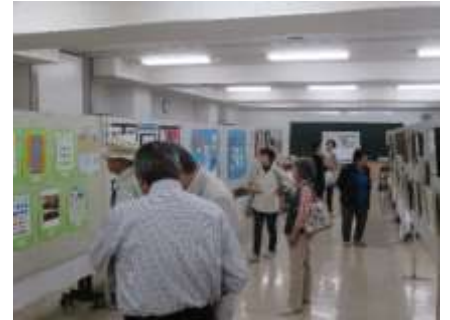
作品展示 力作がそろいました！

10月7日、8日の2日間、岩切市民センターまつりを開催しました。 作品展示・舞台発表・出店等、大いに盛り上がりました。