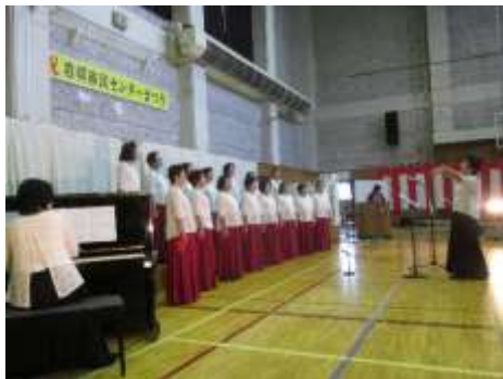
会場に響くきれいな歌声！！