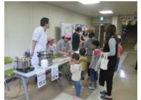
出店部も大変にぎわいました！！