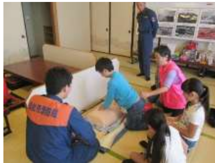
婦人防火クラブによる AED 体験