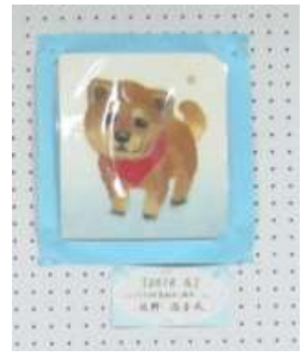
↑タイトル「2018 戌」 作：日野 尚子氏