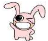
咳エチケットPRキャラクター みやびよん