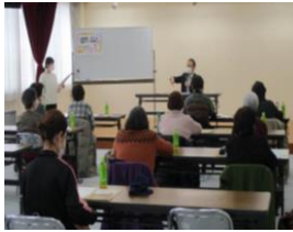
会場：宮城野コミュニティセンター

参加者の皆さんからは、「病気は不安だけど、たいへん有意義なお話が聞けてよかった。」と感想がよせられました。