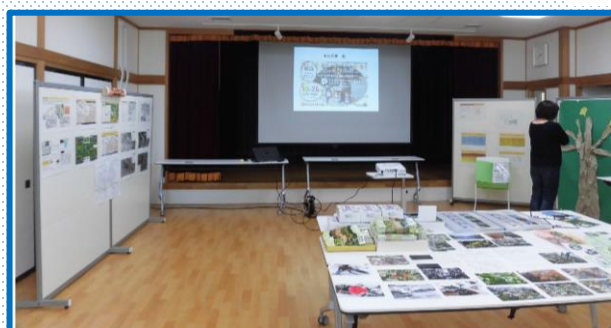
杣江の森に 関する歌の資料