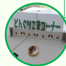
どんぐり コマコーナー

結果として、延べ50人程度の来場者となりました。展示物を見てもらい、子どもたちにはコマ遊び、簡単な木の実のクラフトを楽しんでもらうことで杣江の森をより近くに感じてもらうのではないかと思います。