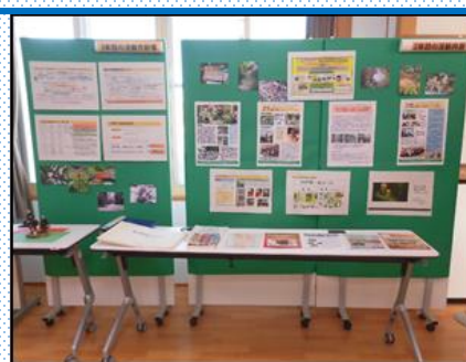
関連資料 (文化財課パンフレット、書籍)