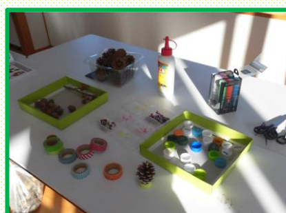
まつぼっくりツリー作り