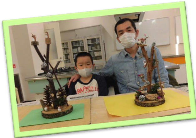
会心の出来に笑み!!