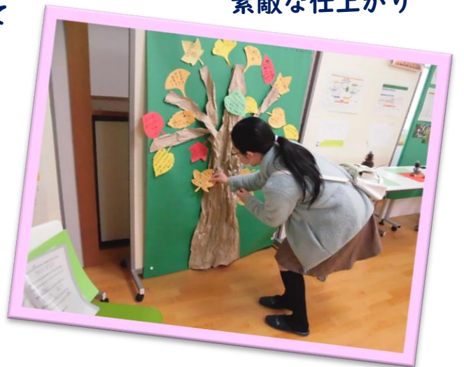
楽しい一時になりましたか？ 感想は葉っぱに記入して木に貼ります!!