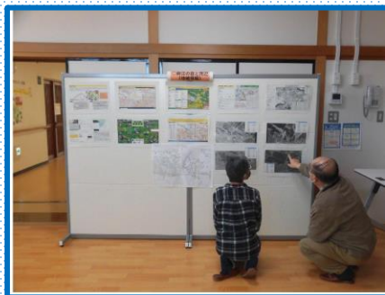
杣江の森周辺情報 (地域情報)