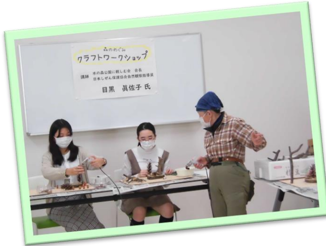
熱心な説明を受けて 熱心に作成中！