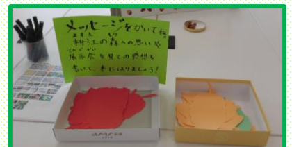
感想記入コーナー