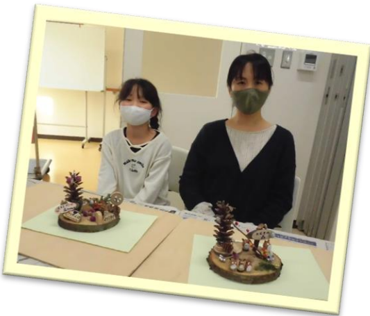
作品完成で 記念の1枚!!