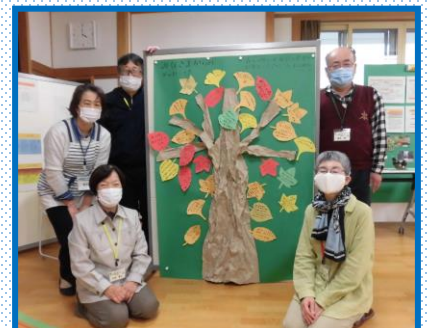
“感想の木”コーナー ※葉っぱの形の紙に感想を書いて いただき、それを貼っていただきま した。