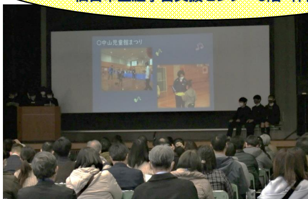
◇ ステージでの成果発表の様子 (子ども事業)

令和5年1月22日(日)10:00~16:45 仙台市生涯学習支援センター6階 体育館