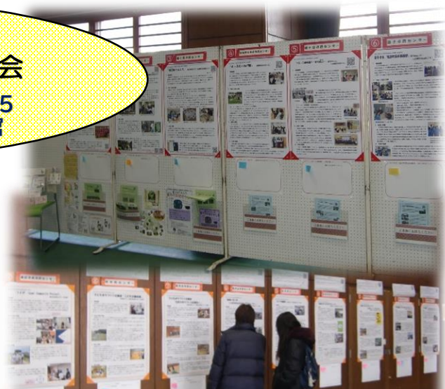
◇各市民センターの成果をポスター展示◇ 展示したポスターは、市民センターのホームページ「生涯学習のすすめ」から見るすることができます。