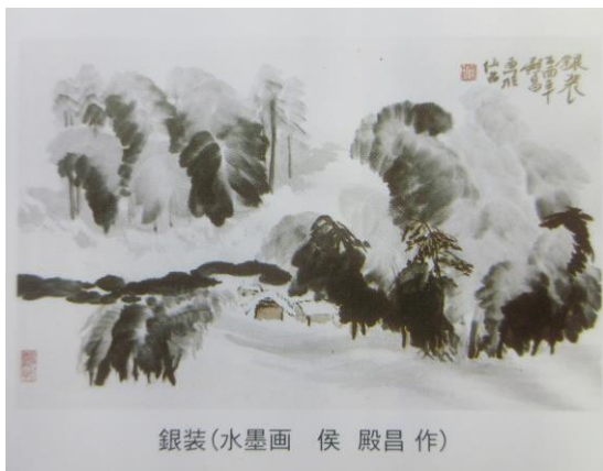
銀装(水墨画 侯 殿昌作)

鎌倉時代、中国より伝わったと言われる「水墨画」。その魅力を知り、水墨画に親しむ2回連続講座です。何か始めたいと思ったシニアの方、ぜひご参加下さい！