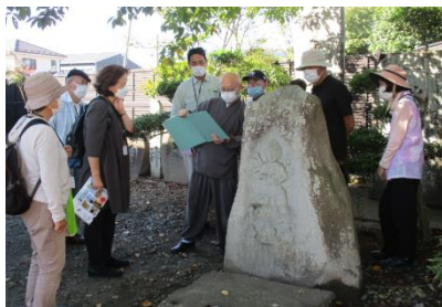
まち歩き（四野山観音堂）