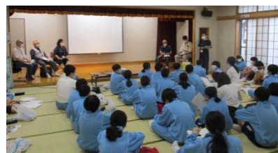
田子中学校の地域学習

令和4年度からは、作成したリーフレットを学びの還元として青少年対象の講座や健康講座・市民企画講座等で活用する予定です。また、育成した人材を活かし、新たな講座へ展開していきます。