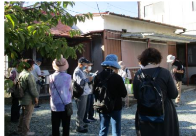
受講生によるガイドボランティア