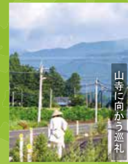
山寺に向かう巡礼