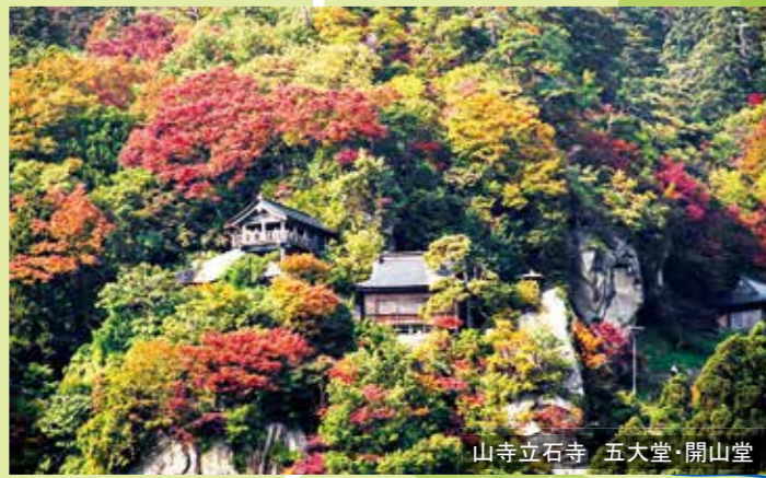
山寺立石寺 五大堂・開山堂