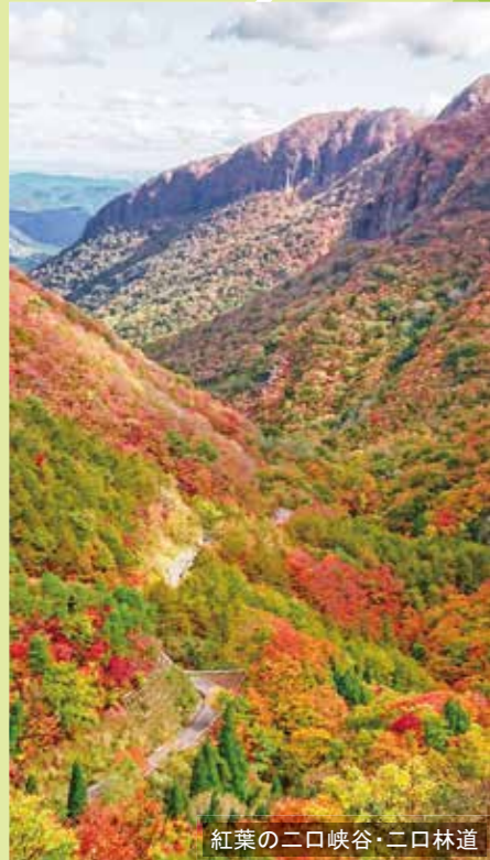
紅葉の二口峡谷・二口林道