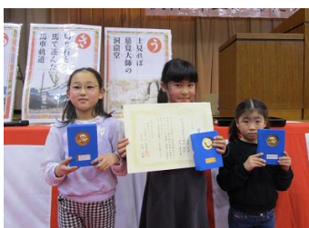
【ジュニアの部】優勝 ゴージャスさわやかチーム(秋保小)