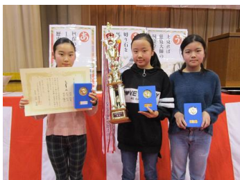
【一般の部】優勝 三つ星チーム(秋保小)