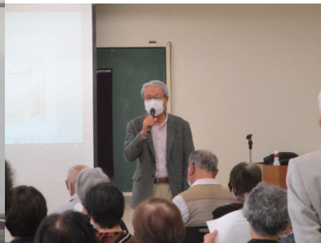
学生会会長からご挨拶をいただきました