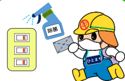
館内各所の消毒の実施