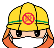
職員のマスク着用