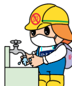
こまめな手洗い・うがい