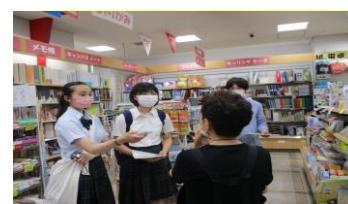
長町の本コーナー