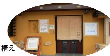
和風モダンな店構え