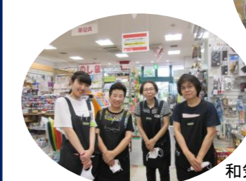
和気あいの従業員の皆さん