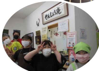
元気いっぱいスタッフのみなさん