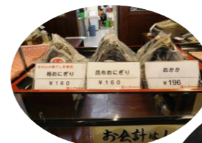
お米にこだわったおにぎりです

長町に店を構えたのが昭和46年。産地厳選のお米を 販売しています。お米にこだわったおにぎりやお弁 当が人気で、午後には売り切れてしまいます。 お米にもっと関心を持ってもらえると嬉しいです。